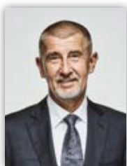
Andrej Babiš předseda vlády ČR

Vážení přátelé, představitelé stavebních společností, společně nyní čelíme vážné krizi, děkuji Vám za Vaši trpělivost s dopady některých vládních ochranných opatření, za Vaši snahu, odhodlanost a odpovědnost při překonání současného krizového stavu vyvolaného náhlou epidemií koronaviru. Přeji Vám, aby dopady této krize na Vaše společnosti byly co nejmenší a aby se Vám podařilo je rychle překonat. Vláda a já osobně při Vás stojíme a věříme Vám. Společnými silami to zvládneme!