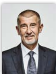
Andrej Babiš předseda vlády ČR

Vážení přátelé, představitelé stavebních společností, společně nyní čelíme vážné krizi, děkuji Vám za Vaši trpělivost s dopady některých vládních ochranných opatření, za Vaši snahu, odhodlanost a odpovědnost při překonání současného krizového stavu vyvolaného náhlou epidemií koronaviru. Přeji Vám, aby dopady této krize na Vaše společnosti byly co nejmenší a aby se Vám podařilo je rychle překonat. Vláda a já osobně při Vás stojíme a věříme Vám. Společnými silami to zvládneme!